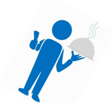
Kochen und Backen