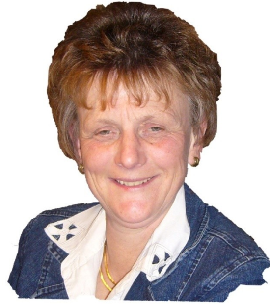
1. Vorsitzende seit 11 Jahren Öffentlichkeitsarbeit an Schulen

Als Flyer gedruckt oder im PDF- Format nicht barrierefrei